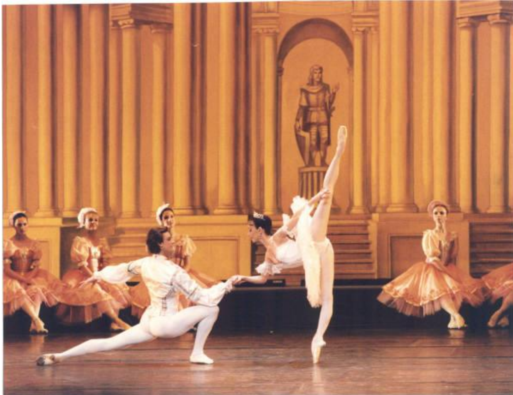
Fotografia 2 - A Bela Adormecida , do Russian National Ballet Theatre.

Na foto a seguir reconhecer e distinguir alguns dos movimentos regidos pela técnica clássica de dança, que são muito suaves e esteticamente belos. Vemos também que o cuidado não fica por conta apenas dos movimentos, também é demonstrado através do figurino que é igualmente gracioso e minucioso.