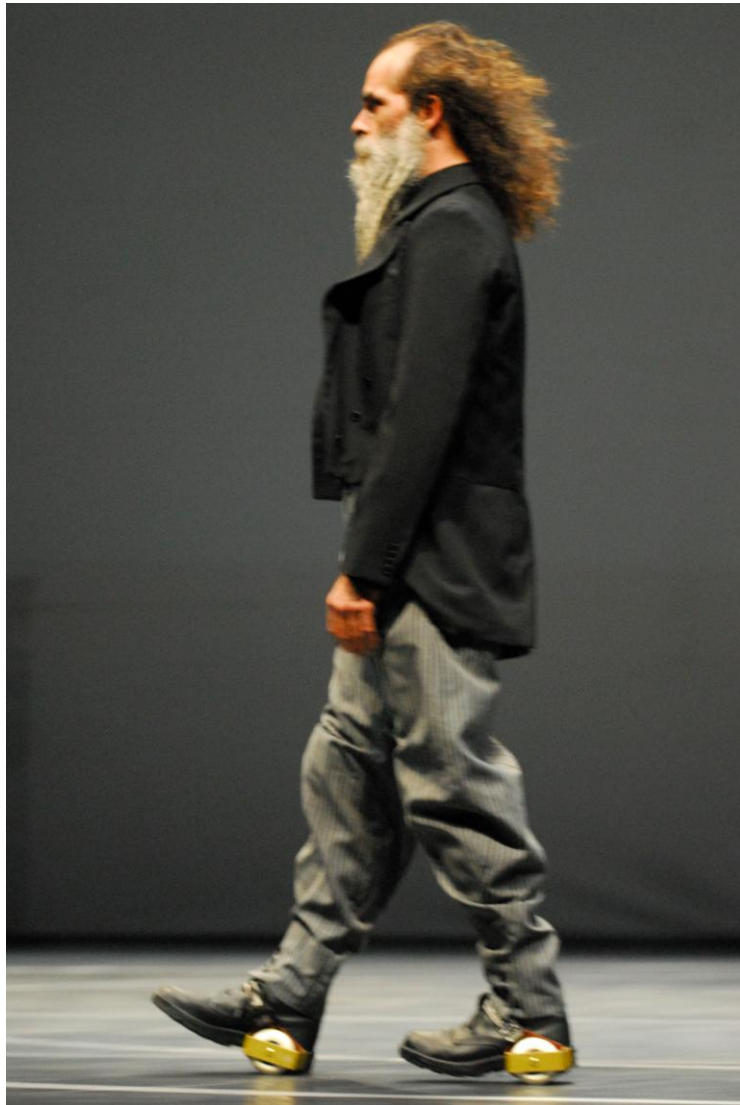
Fotografia 7 – Bailarino sobre rodas.