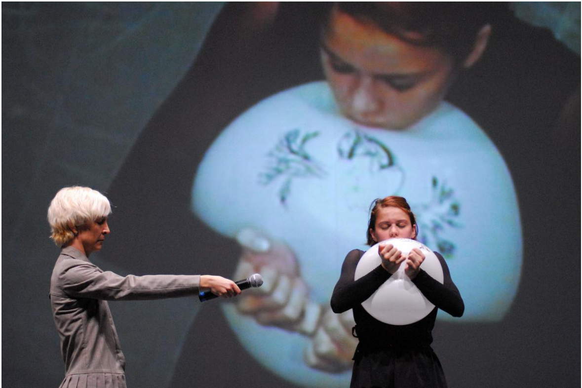
Fotografia 5 – Bailarinos em palco e projetados 2.