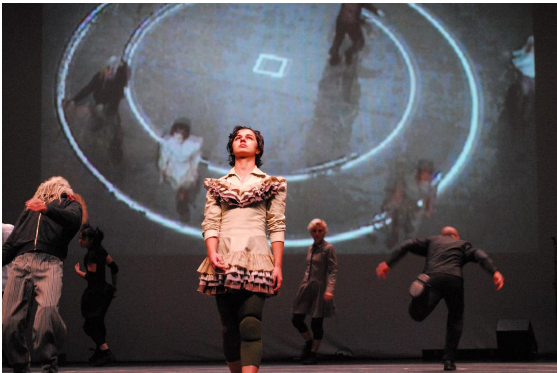
Fotografia 4 – Bailarinos em palco e projetados 1.

Abaixo podemos visualizar, nestas fotos do espetáculo, dois destes momentos em que os bailarinos encontram-se no palco e projetados, como uma forma de extensão.