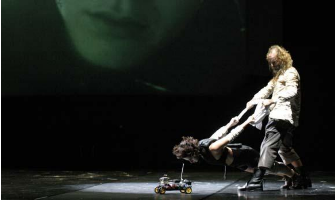
Fotografia 1 - Skinnerbox, 2005.