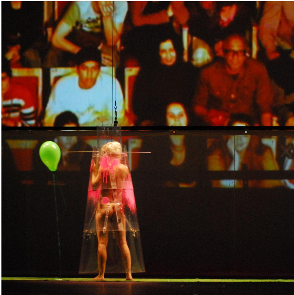
Fotografia 3 – Platéia projetada no espetáculo.

próprio público é utilizado como extensão para criação do corpo biocibernético. A platéia, através das câmeras, e de um programa de detecção de padrão, que o localiza e o transmite com tarjas pretas (o próprio programa reconhece e coloca as tarjas), é constantemente projetado como cenário ao fundo do palco, fazendo com que a platéia observe não somente de suas cadeiras à frente do palco, ela também é cúmplice do espetáculo já que interage diretamente com os bailarinos no palco, participando, fazendo parte, criando uma relação ativa de troca com o grupo que dança no palco. Nesse momento a platéia faz parte daquele contexto, vira espaço cênico, é parte do espetáculo tão importante quanto os bailarinos e os outros elementos.