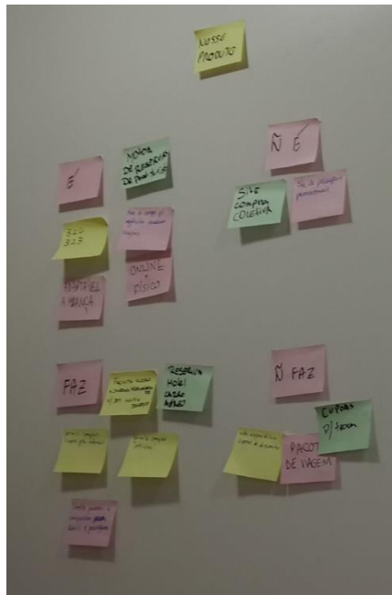
Figura 5 – Exemplo de restrições do Produto

Com essa visão construída, ela servirá de guia para a definição do produto. A atividade seguinte tem como objetivo realizar o alinhamento entre todos os participantes sobre as restrições e possibilidades deste modelo de negócio (Figura 5)