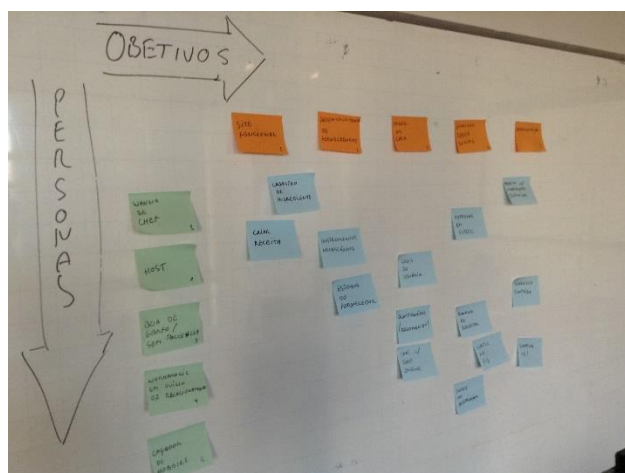
Figura 7 – Exemplo de iniciativas identificadas

Nesse momento será realizado um cruzamento dos objetivos definidos com as personas identificadas, mais especificamente suas necessidades. O resultado desta atividade será a identificação das iniciativas à serem consideradas na construção do modelo de negócios, conforme figura 7.