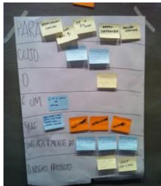
Figura 4 – Exemplo de resultado da Visão do Produto

A atividade “visão do produto” tem como objetivo definir, de forma tangível o objetivo a ser perseguido durante Inception . Nesta dinâmica será explorado questões que visam responder as questões: “ Para quem estou criando este produto? ”, “ Qual a necessidade de negócio a ser atendida? ”, “ Qual o benefício deste produto em relação aos existentes no mercado? ”. Como resultado desta atividade teremos, de forma resumida, as informações necessárias para explicar o nosso produto aos principais stakeholders. A visão do produto ficará semelhante à figura 4.