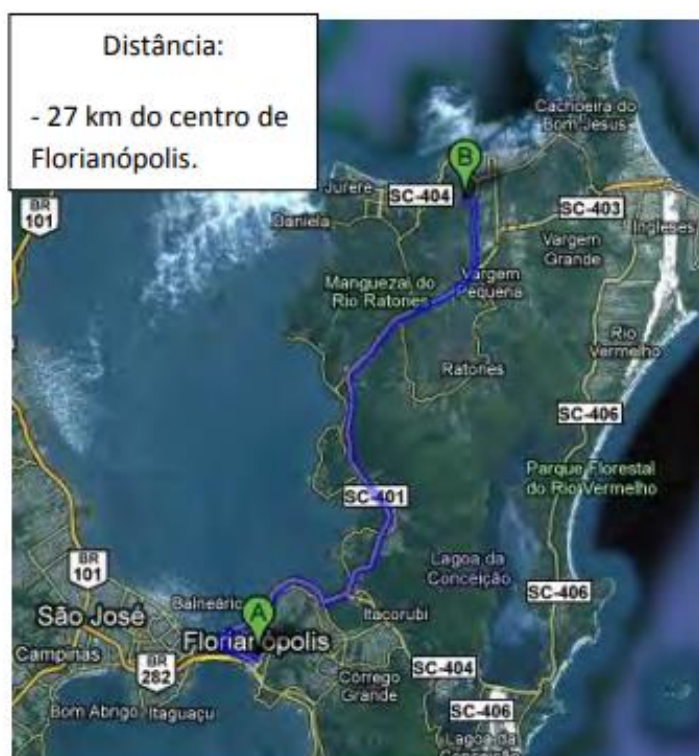
Figura 3 - Localização do Aterro de Inertes - Canto do Lamin.